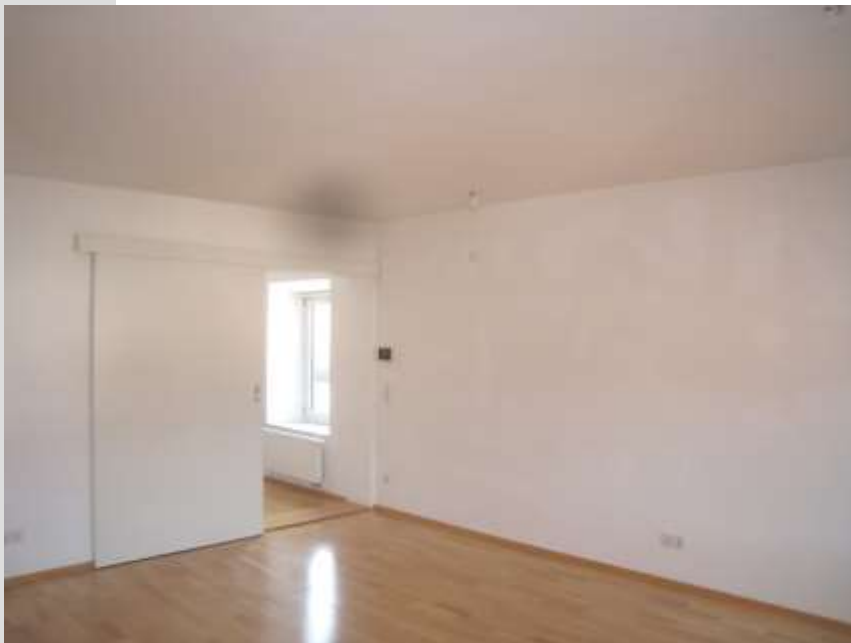
Wohnraum zur Küche