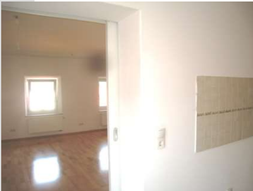
Küche zum Wohnen