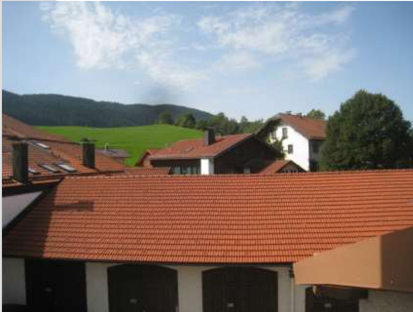
Ausblick von der Küche