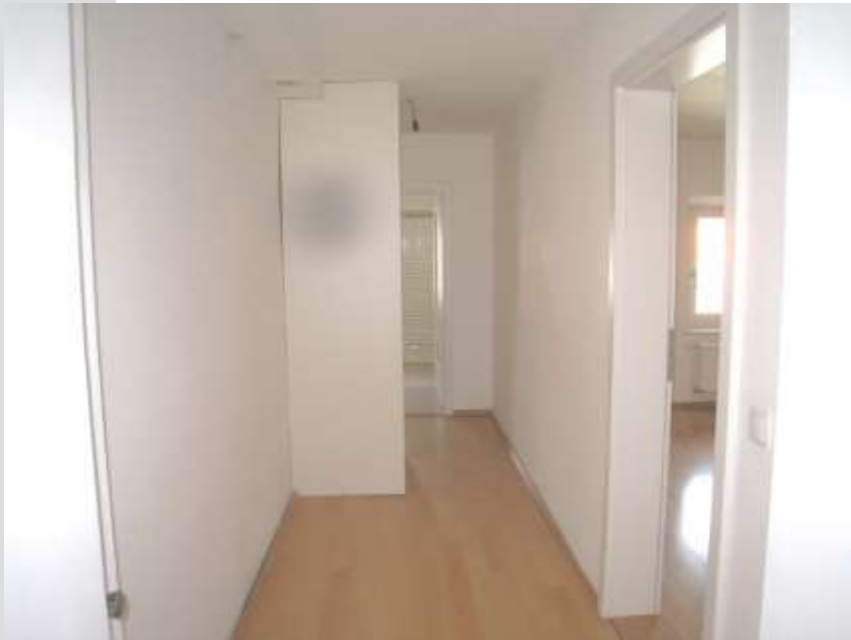
Flur als Ankleide