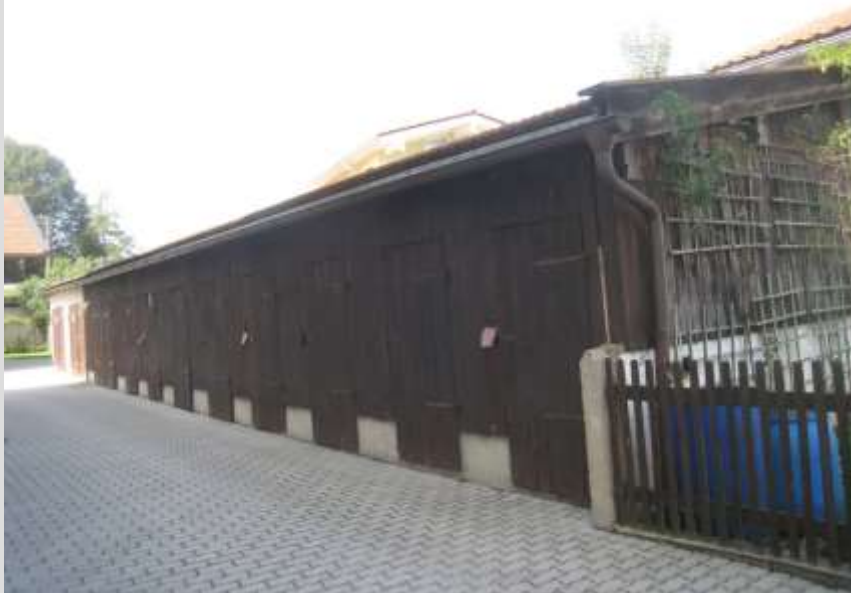
Abstellräume im Hof